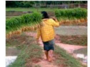
PS 2: Трудові ресурси та умови праці