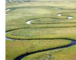
PS 1: Оцінка та управління E&S ризиками та впливами