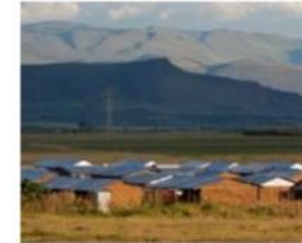
PS 5: Придбання землі та примусове переселення