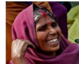
PS 7: Корінні народи