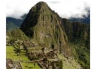
PS 8: Культурна спадщина