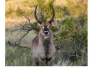
PS 6: Збереження біорізноманіття і стале управління живими природним ресурсами