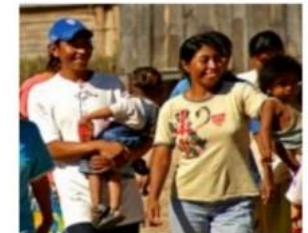
PS 4: Здоров'я, безпека та охорона місцевих спільнот