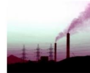
PS 3: Ресурсо-ефективність та запобігання забрудненню